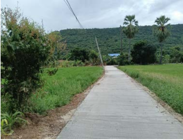
โครงการก่อสร้างถนนคอนกรีตเสริมเหล็กสายโนนรัง จากบ้านนายหัด - ที่นายนายร่วม หมู่ที่ ๓