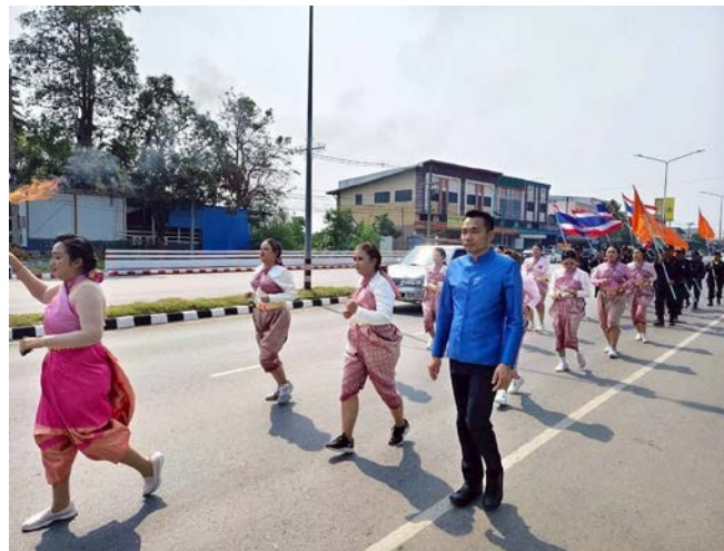
โครงการอนุรักษ์และส่งเสริมวัฒนธรรมประเพณีในวันเข้าพรรษา