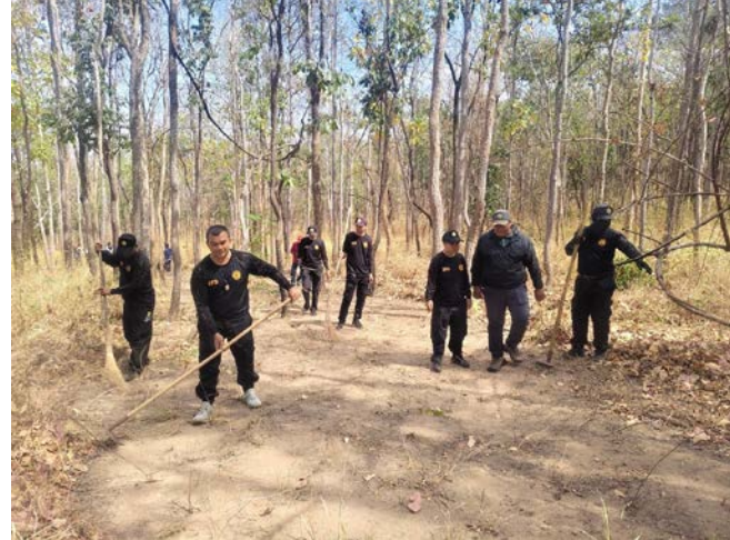
โครงการรณรงค์ป้องกันและแก้ไขปัญหายาเสพติดในชุมชน